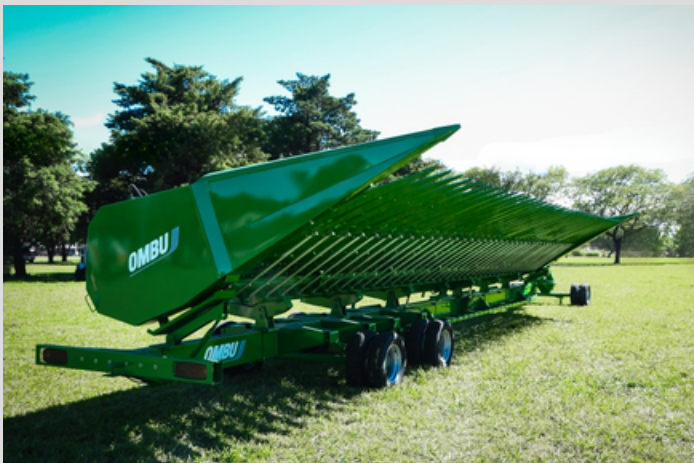
CABEZAL GIRASOLERO CG 2010. Adaptable a cualquier tipo de cosechadora mediante embocador abulonado.